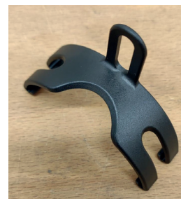
6/ Montageklammer für das hintere Schutzblech