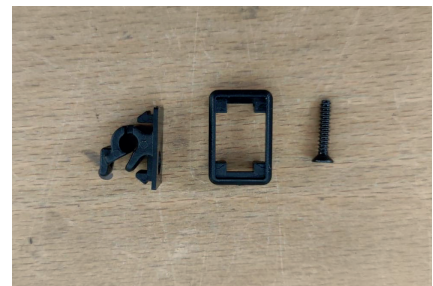
3/ Klemmsatz (2 x im Set)