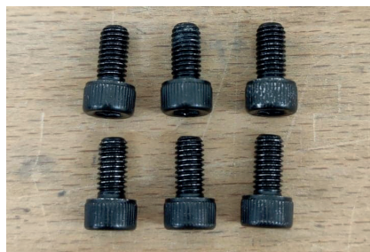
5/ 6x M5 x 10 mm Schrauben