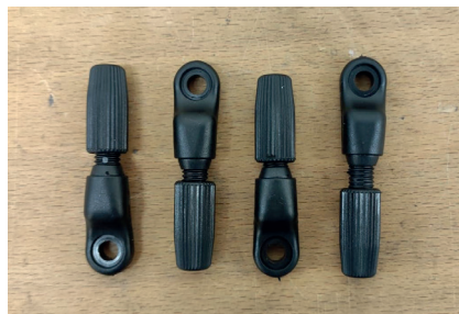
2/ 4x Bügel-Endstücke