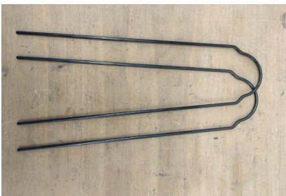
1/ 2x Befestigungsbügel