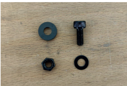
4/ Distanzstück, Schraube M6 x 15 mm, M6-Mutter, M6-Unterlegscheibe